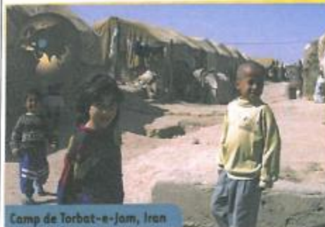
Camp de Torbat-e-Jam, Iran

J e suis née à Torbat-e-Jam. Ce n'est pas une ville, ni une région, c'est un camp de réfugiés, un des plus grands en Iran. Ce n'est pas la joie d'être née ici, mais on a la chance d'habiter dans des